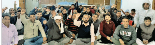
रेवाड़ी। धरने के दौरान नारेबाजी करते पटवारी व कानूनगो।