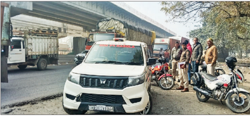
रेवाड़ी। हाइवे पर लगा जाम व मौजूद पुलिस टीम तथा सोमवार रात को छाया घना कोहरा।