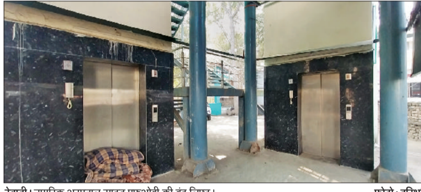
रेवाड़ी। नागरिक अस्पताल साइड एफओबी की बंद लिफ्ट।