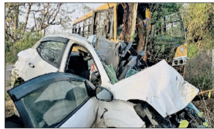
रेवाड़ी। दुर्घटना में क्षतिग्रस्त स्कूल बस व कार, दुर्घटना के बाद मौके पर कारवाई करती पुलिस।

मंगलवार दोपहर बाद शाहजहांपुर रोड पर मोहनपुर गांव के पास तेज रफ्तार ओरा कार स्कूल बस से टकराने के बाद पलट गई। हादसा इतना जबरदस्त था कि कार सवार युवकों की मौके पर ही मौत हो गई। कार को बचाने के चक्कर में स्कूल बस पेड़ से टकरा गई, जिससे बच्चों में चीख-पुकार मच गई। बस चालक हादसे में घायल हो गया, जबकि कुछ बच्चों को भी मामूली चोटें आई हैं। सूचना मिलने के बाद