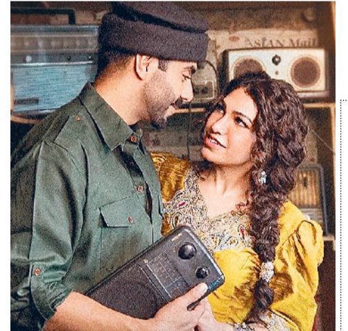
मुंबई। टी-सीरीज ने अपने आधिकारिक इंस्टाग्राम अकाउंट पर गाने की जानकारी देते हुए एक क्लिप शेयर

कुमार की जुगलबंदी देखने को मिल रही है। गाने को दोनों ने मिलकर अपनी आवाज में गाया है और एक बार फिर प्रशंसकों का दिल जीत लिया है। वहीं, साक्षी रती ने गाना लिखने के साथ इसका संगीत भी तैयार किया है।