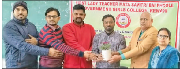
रेवाड़ी। कार्यक्रम में मुख्य वक्ता का स्वागत करते शिक्षक।

जिस समय पुलिस ईआरवी को सड़क किनारे खड़ी करने के बाद वाहनों को निकलवाने और यातायात सुचारू करने में लगी हुई थी, उसी समय एक इजोवा कार कोहरे के कारण ईआरवी में घुस गई। ईआरवी में कोई पुलिसकर्मी नहीं था, जिससे बड़ा हादसा होने से टल गया। ईआरवी बुरी तरह क्षतिग्रस्त हो गई। इजोवा चालक भी हादसे में घायल हो गया। पुलिस ने इजोवा और ट्रक चालकों के खिलाफ केस दर्ज कर लिया। शव को पोस्टमार्टम के बाद परिजनों के हवाले कर दिया गया।